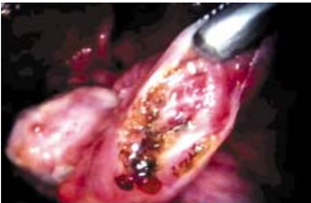
Figura 3 – Salpingostomia: tuba direita.

A gestação tubária bilateral é um evento extremamente raro. Assim como a gravidez hetero-