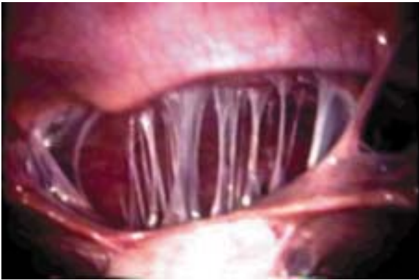
Figura 1 – Síndrome de Fitz-Hugh-Curtis.

Foi iniciada, então, a indução da ovulação com citrato de clomifene, prescrito por um período de seis meses, sem sucesso. Indicada fertilização in vitro em Março/2000, esta não foi realizada devido à falta de condições oportunas para captação de óvulos. Após cinco meses, apresentava queixa de amenorréia desde há 5 semanas e perda de secreção sanguinolenta escurecida via vaginal, associada à dor tipo cólica.