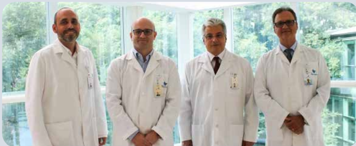
Coordenadores do curso de Cirurgia Minimamente Invasiva - Videocirurgia

Dando continuidade a nossa série de reportagens que vão falar sobre os cursos de Pós-Graduação parceiros do Programa Jovem Cirurgião da SOBRACIL com apoio técnico e científico, nosso enfoque desta edição é o Curso de Pós-Graduação em Cirurgia Minimamente Invasiva do Instituto de Educação e Pesquisa do Hospital Moinhos de Vento, em Porto Alegre.